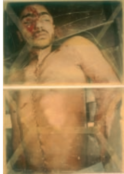
«This Is My Body» (detalj). 2001. Jan Valentin Sæther / BONO © 2004. Oppblåste pressefotos delt opp og lagt i konvolutter kokt i voks.