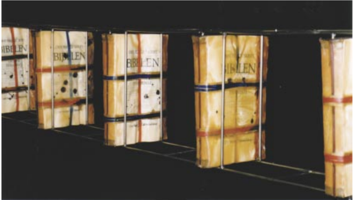
Bibelblokker: Corpus Auctoritatis. Jan Valentin Sæther / BONO © 2003.