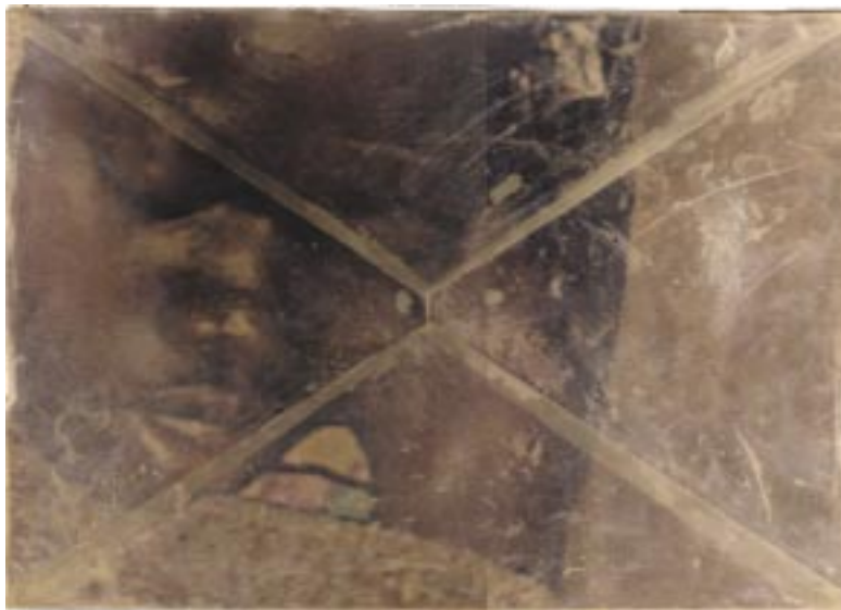
Skisse til «Uganda: Ars Memoria». Jan Valentin Sæther / BONO © 2003.