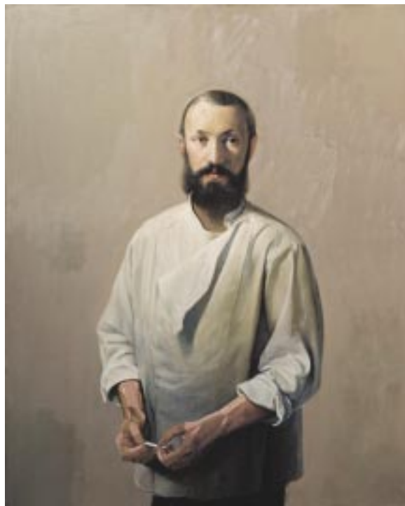
Eksil: Mikhail M. Bakhtin. Jan Valentin Sæther / BONO © 2003.