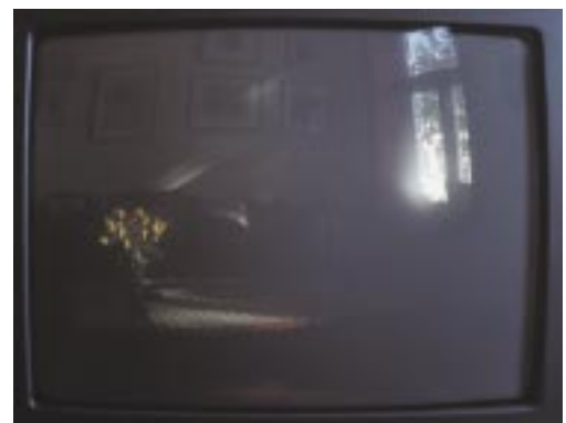
Oikonos 1. Jan Valentin Sæther / BONO © 2003.