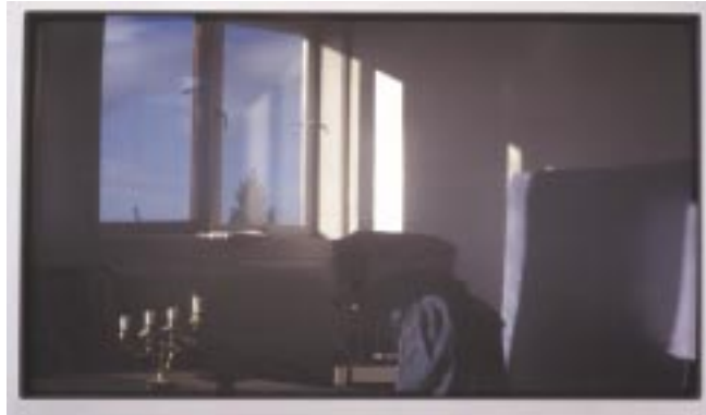
Oikonos 8. Jan Valentin Sæther / BONO © 2003.