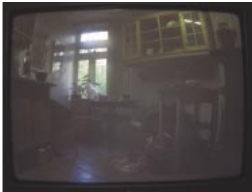
Oikonos 4. Jan Valentin Sæther / BONO © 2003.