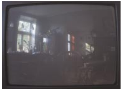
Oikonos 14. Jan Valentin Sæther / BONO © 2003. Foto: Espen Dietrichson