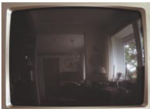
Oikonos 2. Jan Valentin Sæther / BONO © 2003.